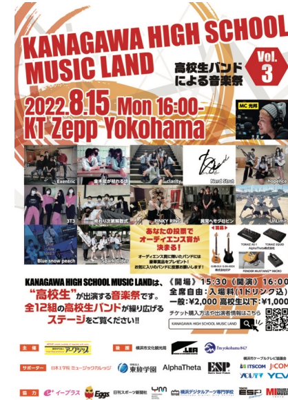
KANAGAWA HIGH SCHOOL MUSIC LAND vol.3 (2022,8/15 KT Zepp Yokohama)