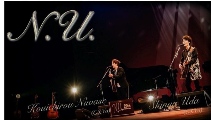
N.U. ホールコンサート Road to...約束の場所へ -first step- (2023,1/9 鎌倉芸術館)