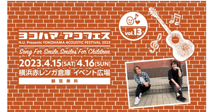
ヨコハマ アコフェス2023 (2023,4/14~16 横浜赤レンガ倉庫)