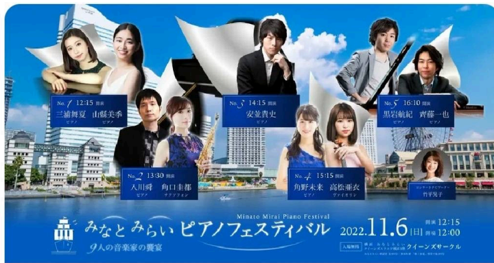
みなとみらいピアノフェスティバル (2021,11/6 クイーンズサークル)