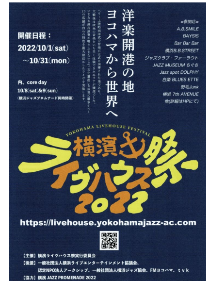
横浜ライブハウス祭り2022 (2022,10/1~31 市内ライブハウス)