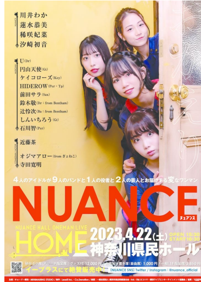
NUANCE 神奈川県民ホールワンマン[HOME] (2023,4/22 神奈川県民ホール)