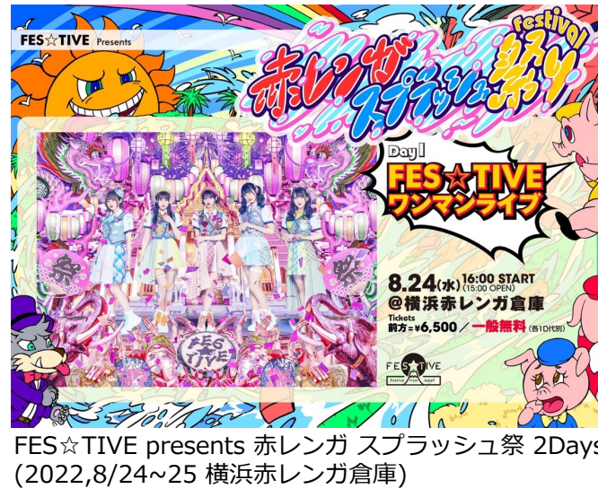
FES☆TIVE presents 赤レンガ スプラッシュ祭 2Days (2022,8/24~25 横浜赤レンガ倉庫)