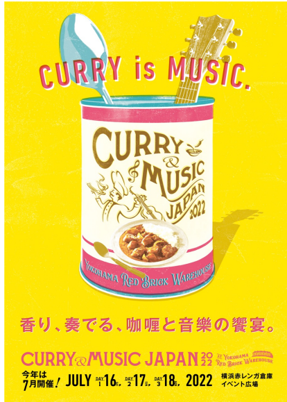
CURRY&MUSIC JAPAN 2022 (2022,7/16~19 横浜赤レンガ倉庫)